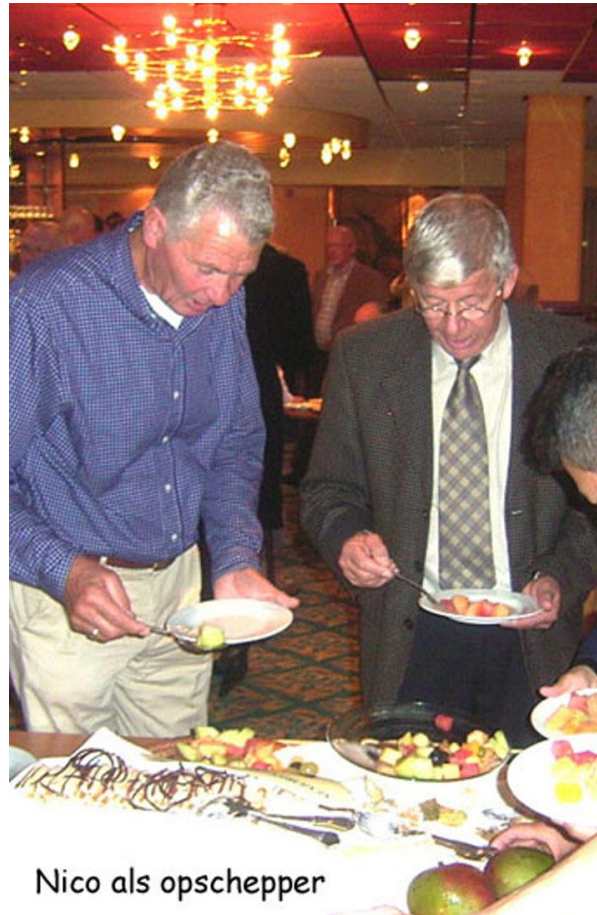
Nico als opschepper

“De sluiting van de locatie Pernis in 1995/96 zorgde voor een tweede schokgolf door het voltallige personeel van Nerefco. De Pernissers raakten door de sluiting van de raffinaderij in de eerste plaats hun zo vertrouwde werkomgeving kwijt waar ze soms al tientallen jaren werkten. En in de tweede plaats hingen er bij Nerefco 250 ontslagen in de lucht. Een getal dat iedereen toch wel erg ongerust maakte. De reorganisatie van Nerefco kwam dus hard aan zoals de meesten onder u nog wel uit eigen ervaring zullen weten. We hebben er met z'n allen, ook u waarschijnlijk, heel wat nachten van wakker gelegen. De verantwoordelijkheid voor een zo goed mogelijke afloop drukte zwaar op de schouders van de ondernemingsraad. Ik maakte toen echter geen deel meer uit van de OR. Wel was ik op dat moment als lid van de kadergroep van het FNV zeer betrokken bij de onderhandelingen.”